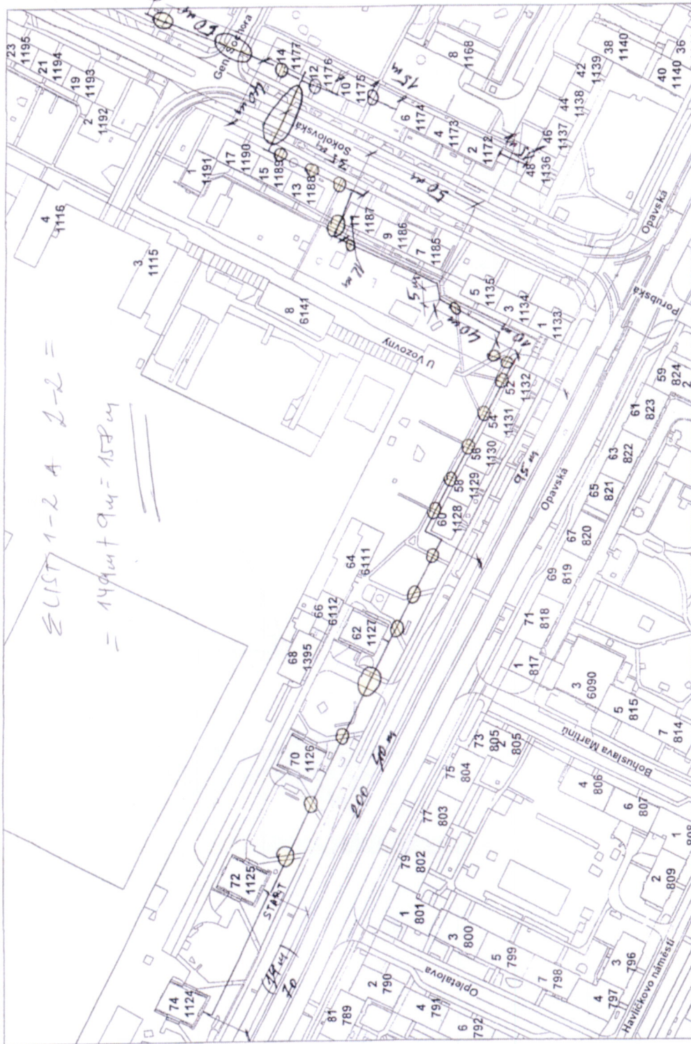
Mapa v měřítku 1:2000

CELKOVÁ PĚTKA VÝŠNÍ SÍŤ = 149 m + 94 m = 158 m